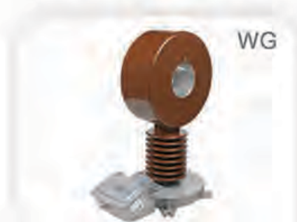
Outdoor Current Transformer

این نوع ترانس در مواردی کاربرد دارد که مسیر عبور جریان به صورت شینه بوده و امکان قطع آن و ایجاد ترمینال مناسب جهت اتصال به ترانس جریان معمولی وجود نداشته باشد. این ترانس قابل بهره برداری در سطوح ولتاژی ۱۲ تا ۳۶ کیلوولت می باشد.