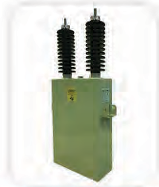
Power Factor Correction Capacitor - KLV1

این نوع خازن ها قابل بهره برداری تا ولتاژ نامی ۲۰ کیلوولت فاز به زمین می باشد. در این خازن ها از عایق پلی پروپیلن و روغن استفاده شده و طراحی و تست های کارخانه ای و تایپ براساس استاندارد IEC 60871-1 می باشد. مجهز بودن به مقاومت دشارژ و همچنین امکان ارائه فیوز داخلی در صورت درخواست مشتری از قابلیت های طراحی این نوع خازن ها می باشد.