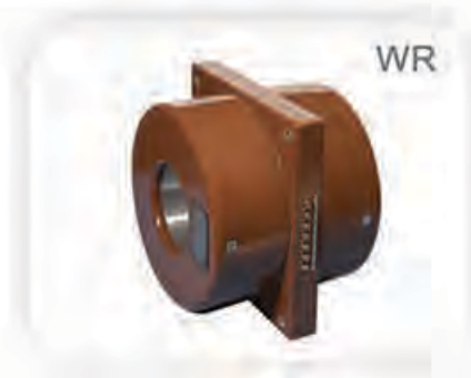
Indoor Current Transformer