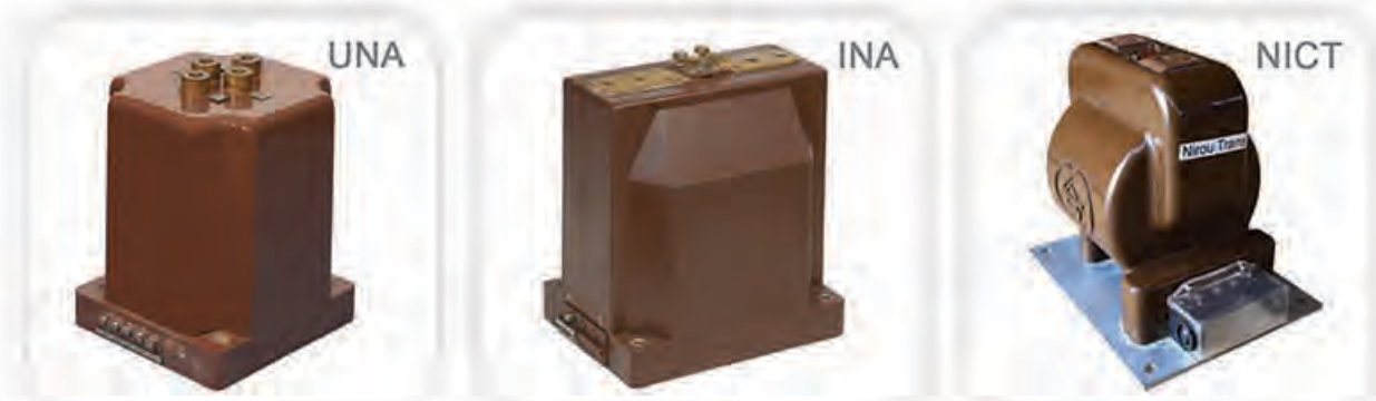
Indoor Current Transformer

این نوع ترانس قابل بهره برداری در سطوح ولتاژی ۱۲ تا ۳۶ کیلوولت بوده و به دلیل استفاده از رزین اپوکسی ریخته گری شده تحت خلاء دارای استقامت مکانیکی بالا و پایداری عایقی طولانی مدت می باشد.