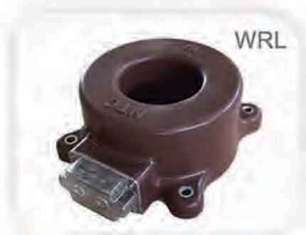
Indoor or Outdoor Current Transformer