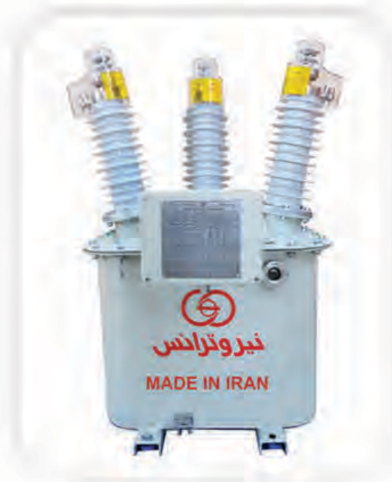
Metering Out Fit - MOF

این ترانسفورماتور شامل سه ترانس جریان و دو ترانس ولتاژ می باشد که مقدار ولتاژ و جریان سه فاز را به صورت همزمان اندازه گیری می نماید. این ترانس در شبکه هوایی نصب می شود و جایگزین پست زمینی می باشد.