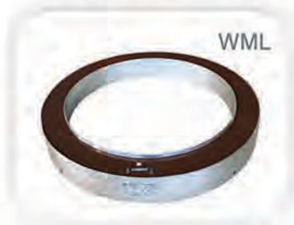
Indoor Current Transformer