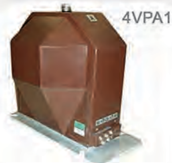
Indoor Voltage Transformer