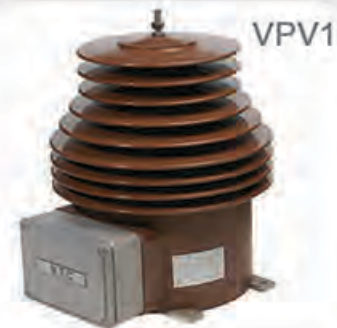
Outdoor Voltage Transformer